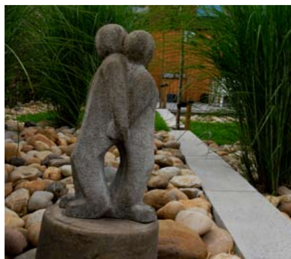
Dit beeld komt prachtig uit tegen de achtergrond van keien en siergrassen.