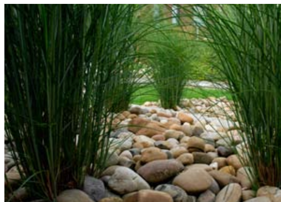
Japans prachtriet ( Miscanthus sinensis 'Gracillimus') groeit tussen de keien.