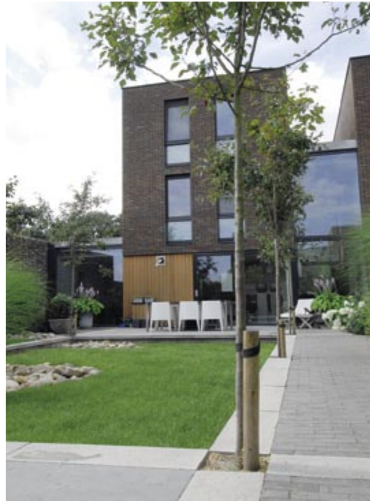
Drie soorten bestrating zijn gebruikt: betonnen opsluitbanden, vierkantemeter-tegels van Chinees hardsteen en antraciet dikformaat van Schellevis.

Voordeel van de vaasvormige habitus van Miscanthus sinensis 'Gracimilus' is dat er onder de planten goed zicht blijft op de keien. Bewust is de transparante wand niet begroeid.