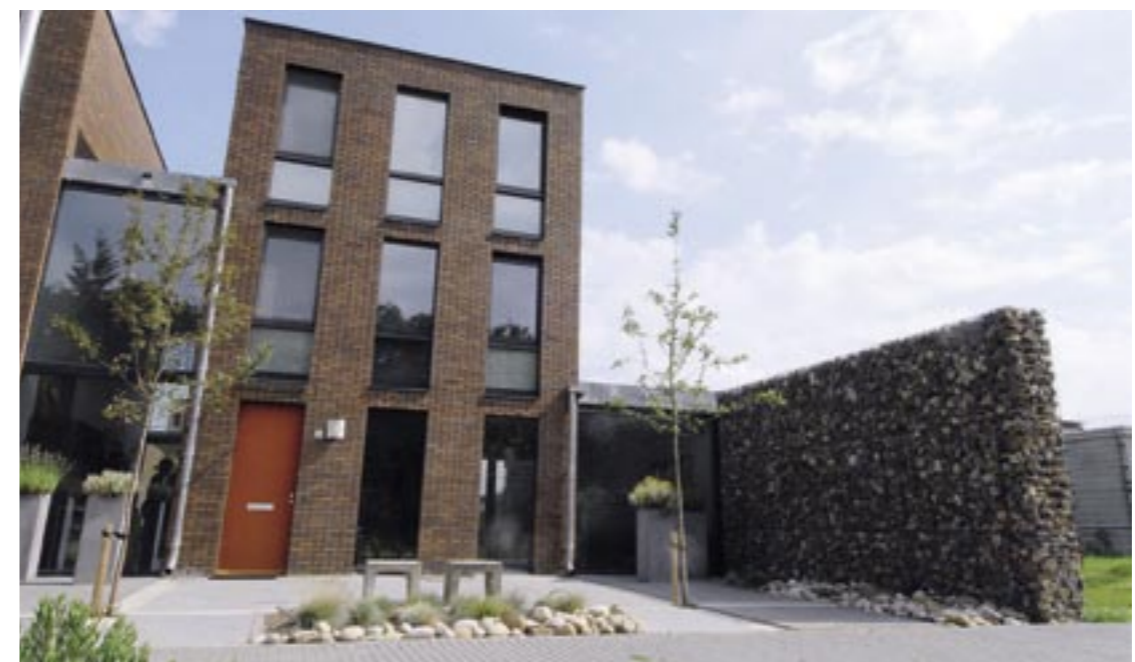
Ook in de voortuin spelen lijnen, morenekeien en twee Malus 'Liset' de hoofdrol.