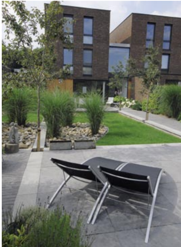
Zicht vanaf het terras achter in de tuin.