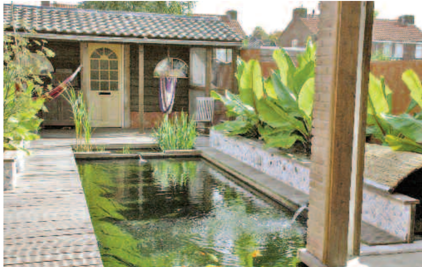
De zwembijver met daarin koikarpers ligt centraal in deze tuin; het grote bananenblad, hangmatten en een heuse vuurplaats zorgen voor een tropisch sfeertje.

„Ondanks de strakke vormgeving bleef de sfeer van de boerderij centraal staan. De boomgaard met ouderwetse fruitsoorten en kort gemaaide graspaden versterken die sfeer van toen. Bij het verhardingsmateriaal in deze tuin viel de keuze op gebakken klinkers afgewisseld met grind en keien van Portugees graniet”, legt Van de Heijkant uit.