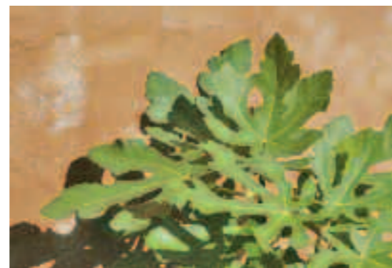
Om een oude uitstraling te krijgen werd de oranje latexverf aangebracht met een grove roller.

voegde Vlasman ronde lijnen van beige morenenkeien toe. Zo ontstond een sterk contrast met de rechte vormgeving. Het geheel werd nog contrastrijker door het gebruik van veel siergrassen. „Met de cirkels van morenen en de aanplant van grassen hebben we de in eerste instantie strak vormgegeven tuin een natuurlijker uitstraling gegeven. Een harmonieuze combinatie van natuur met architectuur”, licht Vlasman zijn keuze toe. Zo ging dat ook in een boerderijtuin waar strakke lijnen van buxus en beuk werden afgezwakt door onder andere hortensia's, rozen en een kleurrijk bloemenmengsel.