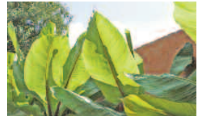
In een tropische tuin mogen bananenplanten uiteraard niet ontbreken; met hun grote blad versterken ze het junglegevoel. Ze kunnen enkele meters hoog worden.

Tot slot is er een beplanting samengesteld van subtropische planten die met wat zorg best wat winterkou kunnen trotseren. Het meest dominant zijn de bananenplanten die tot enkele meters hoogte uit kunnen groeien. Tegen de muur groeit een vijg en ook staat er een bladhoudende Magnolia grandiflora . De als een grillige knotvorm uitgroeiende platanen zorgt voor schaduw op het terras. Al deze ingrediënten samen