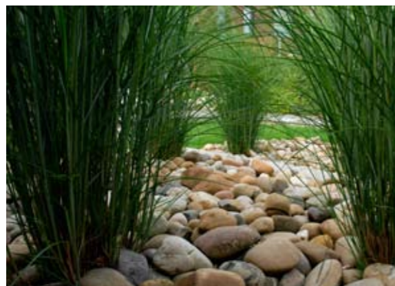
Japans prachtriet ( Miscanthus sinensis 'Gracillimus') groeit tussen de keien.