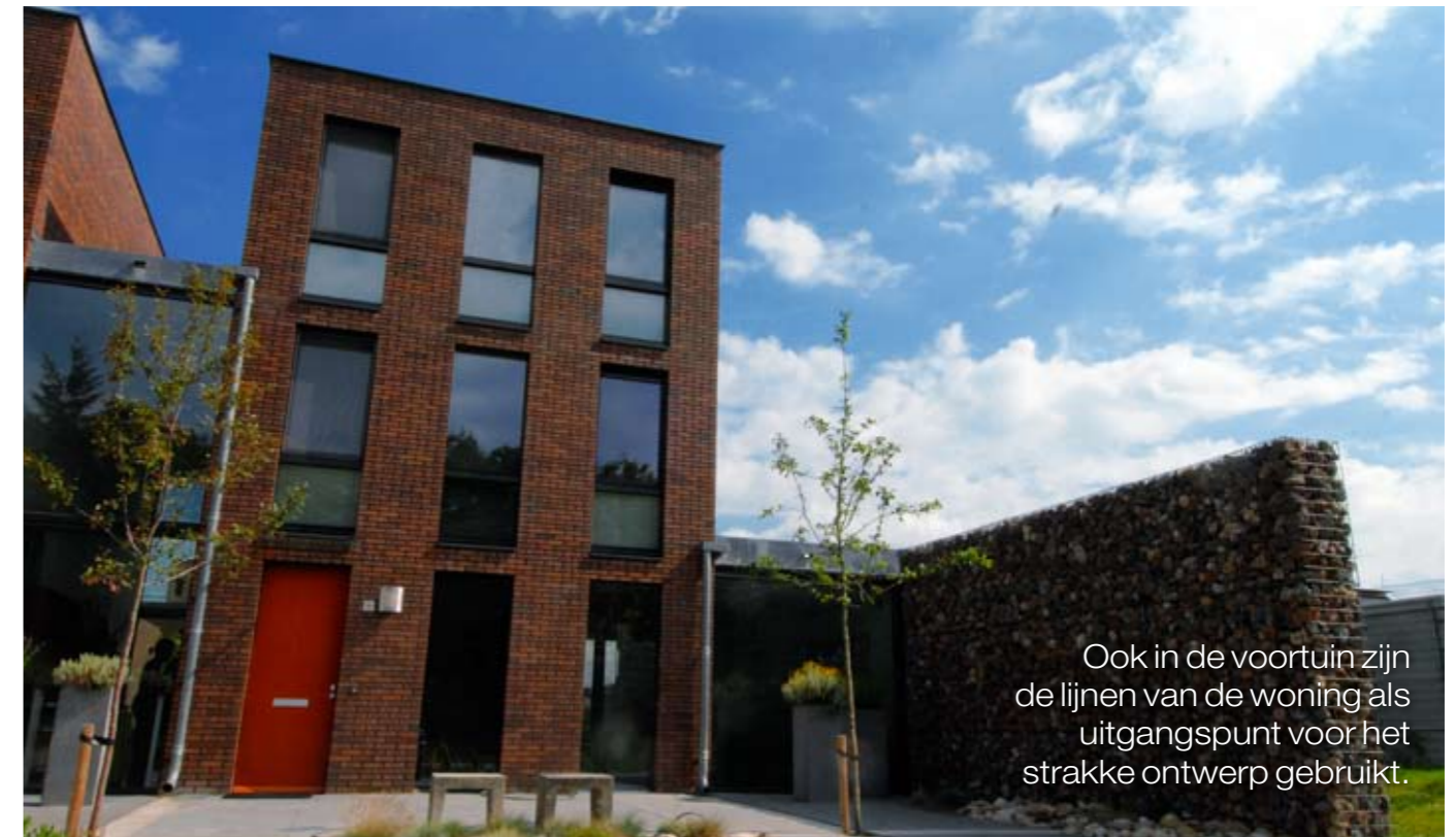
Ook in de voortuin zijn de lijnen van de woning als uitgangspunt voor het strakke ontwerp gebruikt.

Gekozen is voor morene keien omdat deze aansluiten bij de maaskeien in de schanskorf. Deze schanskorf vormt aan die kant van de tuin de erfafscheiding en was al aanwezig. Door hetzelfde