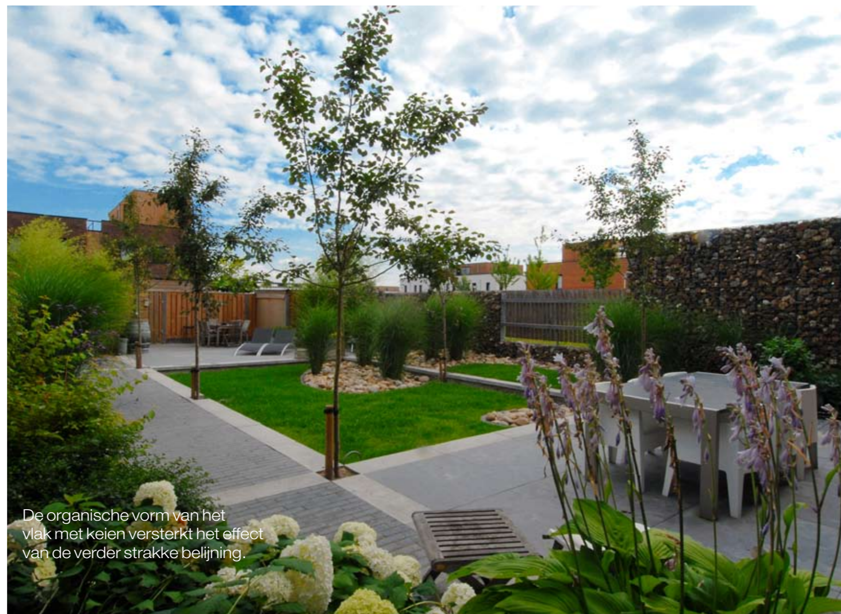
De organische vorm van het vlak met keien versterkt het effect van de verder strakke belijning.